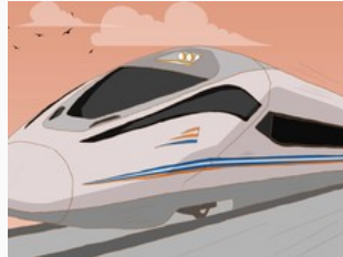
INKA Siap Produksi Kereta Cepat untuk Rute Jakarta-Surabaya