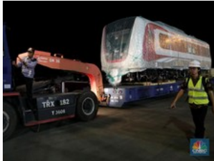
Curhat Bos INKA: Pasar Ekspor Susah, Di Mana-mana China