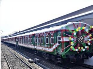
Tuut..Tuut... Kereta Api Made in RI Beroperasi di Bangladesh